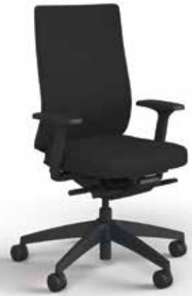
Coussin se:do, avec accoudoirs