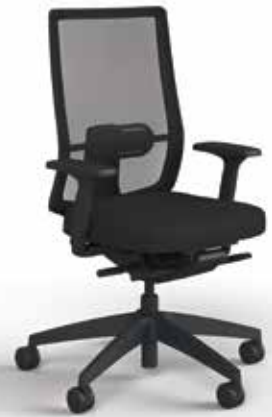
Membrane se:do, avec accoudoirs