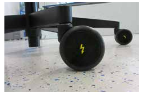
se:do disponible également en version antistatique