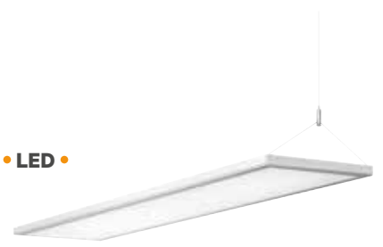
Knürr® Console LED pendant