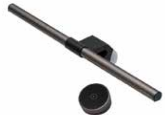
Screen Bar Halo