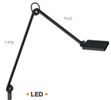
Knürr® Task LED L