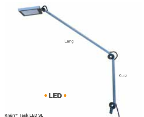
Knürr® Task LED SL