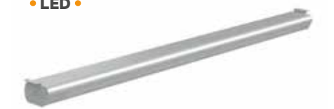
Knürr® Smart LED