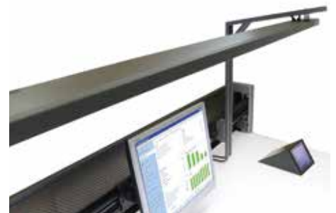
Knürr® Lumax LED Leuchte